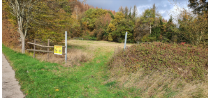
Derzeit liegt der Bolzplatz brach. Das sollte sich ändern.

fußläufig für nahezu 500 Haushalte in der Umgebung gut erreichbar wäre. Schon jetzt ist der Weg zwischen Biesfeld und Offermannsheide vor allem bei gutem Wetter eine beliebte Strecke für SpaziergängerInnen und RadfahrerInnen.