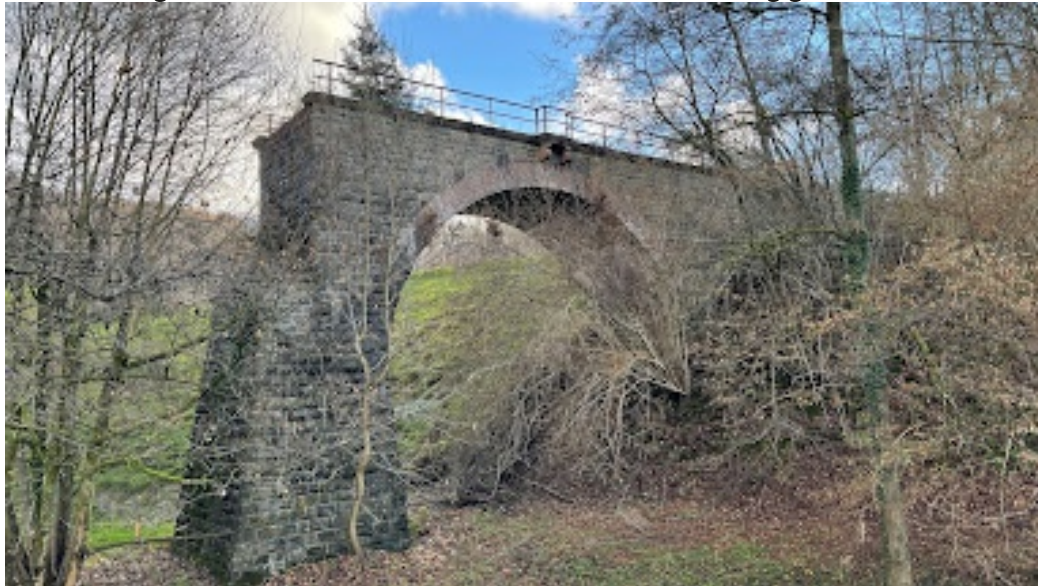
Die alte Eisenbahnbrücke über die Sülztaalstraße in Bielstein soll für den Radverkehr wiederhergestellt werden. In welcher Form wird derzeit noch geplant.

In den Umlandgemeinden aber tut sich einiges. So schreitet die Planung für den weiteren Ausbau des Radweges auf der alten Bahntrasse zwischen Lindlar und Untereschbach voran. Nachdem die Trasse von Lindlar bis Bielstein bereits erschlossen worden ist und auch von vielen Körtenerinnen und Körtenern aufgrund der Nähe und Attraktivität häufig genutzt wird, steht