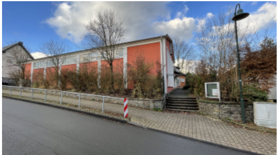
Die Turnhalle Offermannsheide mit einer Sportfläche von 300m 2

von der SPD beantragten Bürgerversammlung traten weitere Personen dem Förderverein bei. Dennoch ist es für die Zukunft der Turnhalle Offermannsheide sehr wichtig, weiterhin neue Unterstützerinnen und Unterstützer zu finden. Alle Informationen zu den