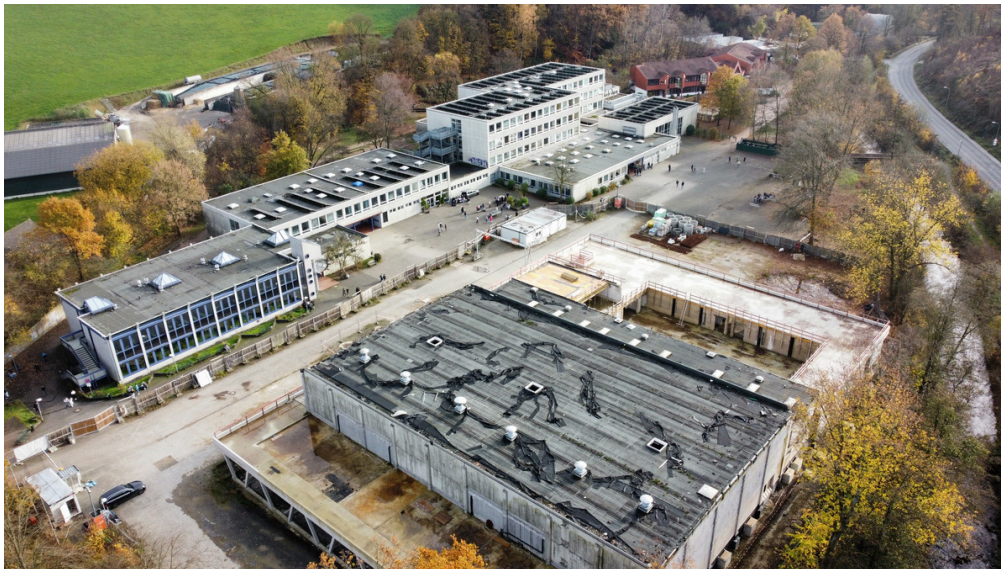
Baustopp an der Mehrzweckhalle seit Oktober 2025 – mit spürbaren Folgen für Zeitplan und Kosten der Gesamtschulsanierung.

Nach der einvernehmlichen Beendigung der Zusammenarbeit zwischen der Gemeinde Kürten und dem bisherigen Architekten der Gesamtschulsanierung wurde die Baustelle der Mehrzweckhalle im Oktober 2025 gestoppt – voraussichtlich bis April 2026. In dieser Zeit soll ein neuer Architekt für die Mehrzweckhalle gefunden werden. Zudem ist eine